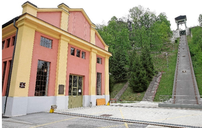
Slika 9: HE Završnica

Hidroelektrarna Završnica je bila prva slovenska javna elektrarna, graditi so jo začeli leta 1911, obratovati pa je začela 25 februarja 1915. Elektrarna je neprekinjeno delovala 90 let po njeni zaustavitvi so elektrarno obnovili ter uredili tehniški muzej. Voda je v hidroelektrarno pritekala iz akumulacijskega jezera Završnica. Leta 2005 pa so zaradi potrebe po sodobnejši elektrarni odprli hidroelektrarno Moste, ki pa je prva hidroelektrarna na Savi.