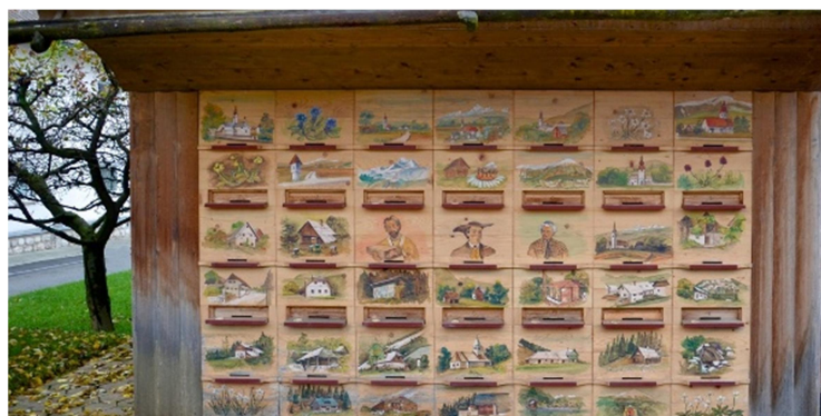
Slika 7: Čebelji raj Noč

Čebelarstvo Noč poteka že več generacij. Trenutno čebelarja Anton ter Boštjan Noč predstavljata čebelarstvo ter tradicijo njune družine. V Čebeljem raju si lahko v notranjosti ogledamo čebele skozi stekleno kupolo ter tako vidimo kako poteka delo čebel v čebelnjaku. Na voljo je pa tudi degustacija medu in sicer do 5 različnih vrst, degustacija medolade, medu v jogurtu ter cvetnega prahu. Pred čebeljim rajem je na ogled tudi 60 kvadratov velik vrt medovitih rastlin.